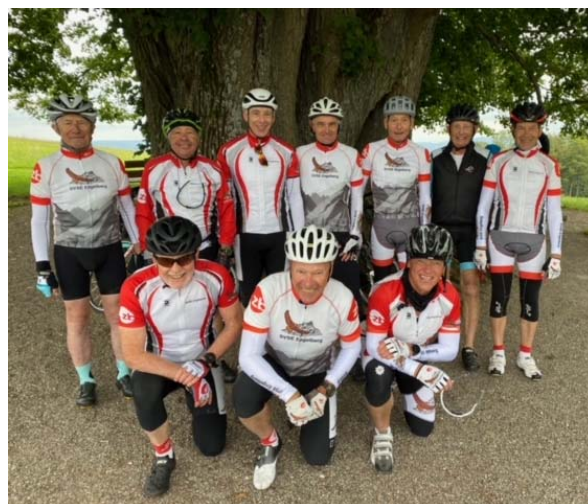
10 stramme Burschen tanken Kraft unter der Linde von Linn

Ab Villnachern fuhr die eine Gruppe den kürzeren, aber sehr steilen Weg, die anderen benützten die längere nicht so steile Strecke über Umiken.