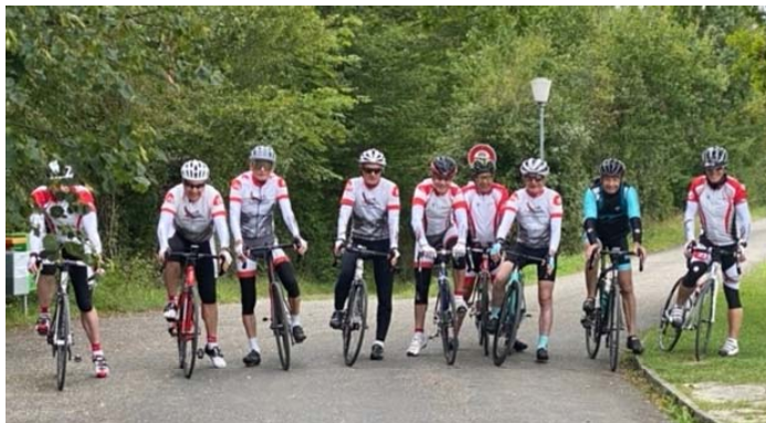
Die Gruppe vor dem Stauwehr bei Schinznach

Am Baldegger- und Hallwilersee entlang führte der Weg nach Meisterschwanden + Seengen. Auf der Strasse mit festem Kies (Hallwilersee) erlitt Toni's Drahtesel einen Blatten.